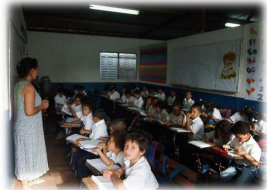
De 3 e klas