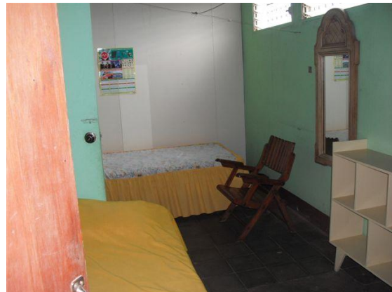
Een van de 2 slaapkamers Een tweepersoons kamer en een eenpersoons kamer.

Er is douche en het gebruik van water en elektriciteit is inbegrepen in de prijs. Gebruik keuken en koelkast is oké, met een kleine verhoging van de maandelijkse kosten. Verder is doña Olga van de Baptistische kerk en dat betekent dat er niet gerookt of alcohol gedronken mag worden in huis. Men krijgt een sleutel van het huis. Verder gegevens volgen spoedig, incl. huisregels.