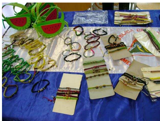
Originele Nicaraguaanse armbandjes.