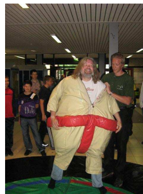
De jeugd vermaakt zich !!!